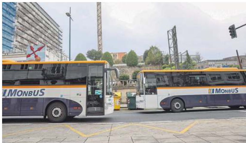
La empresa lucense Monbus gestiona rutas de transporte en toda España.

¿Cómo funciona el modelo de reservas online ? El sistema es sencillo. Lo primero es disponer de una tarjeta TMG (Tarjeta de Movilidad de Galicia) o la Xente Nova (ideada para usuarios entre 4 y 20 años y que permite realizar cada mes hasta 60 viajes interurbanos gratuitos). Una vez se cuenta con ella, la reserva de