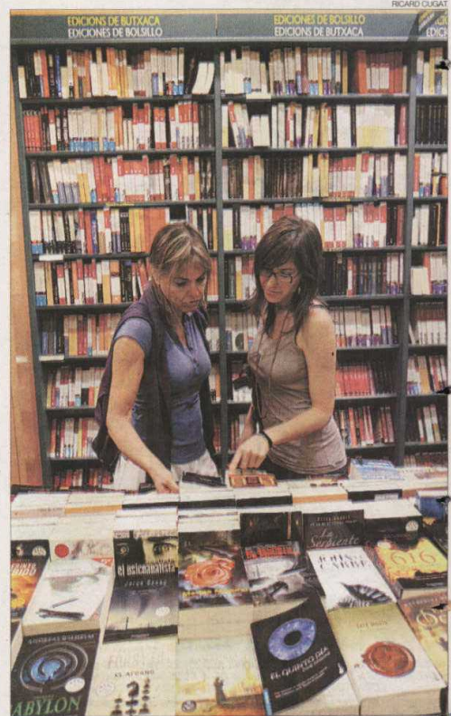
► Sección de libros de bolsillo de la Casa del Libro.