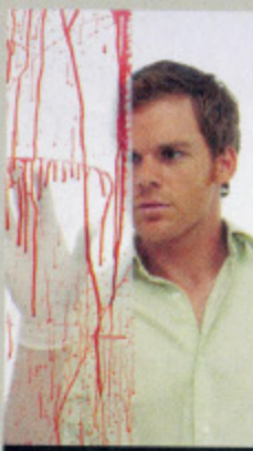
M.C. Hall es Dexter.

Psicópata pero simpático: así es el popular personaje de Jeff Lindsay.