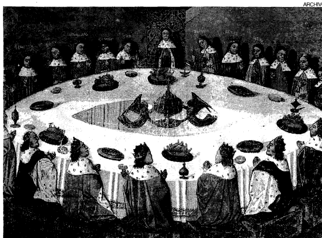
Pintura francesa del siglo XV que escenifica a los caballeros de la mesa redonda ante la aparición del Santo Grial el domingo de Pentecostés. La búsqueda del cáliz con la sangre de Cristo es uno de los enigmas con los que mejor juega Dan Brown, como se explica en varios de los libros (abajo) que han salido a rebufo del éxito del autor.