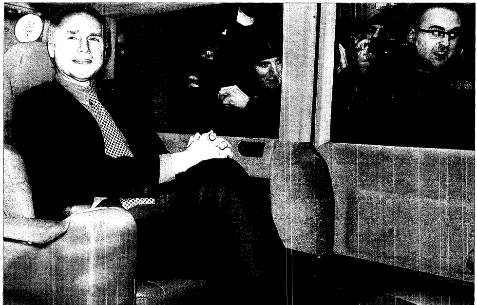
El escritor Dan Brown, en una limusina, a la salida del juicio por plagio que tuvo que afrontar en Londres.

Antes que Brown, Ken Follet ( Los pilares de la tierra ) y Umberto Eco ( El nombre de la rosa ) lograron captar con éxito el interés del público sin causar el rechazo de la crítica con una combinación de intriga e historia. Hasta la publicación de El código Da Vinci , Dan Brown era un escritor de segunda fila que había publicado tres novelas: La conspiración , Ángeles y demonios y La fortaleza digital . Ninguna de ellas había sido traducida al castellano. De hecho, cuando el Código comenzó a tener algún éxito en Estados Unidos, fue