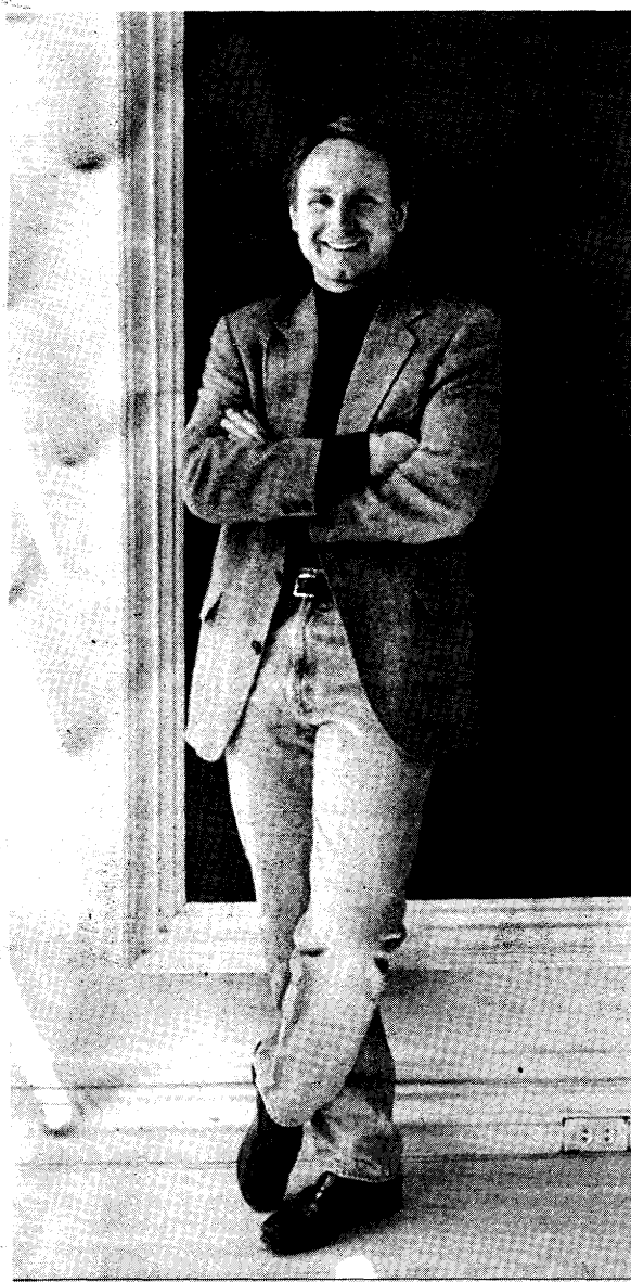
DAN BROWN. El autor de 'best-sellers' posa desenfadadamente.

La polémica suscitada ha tenido un efecto paradójico. Según fuentes de la que hasta ahora ha sido la editorial en España de Dan Brown, Umbriel, cuando comenzaron la