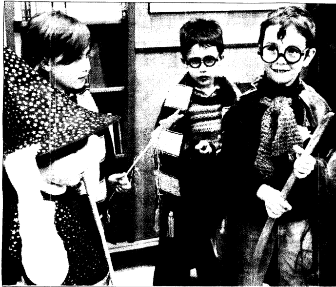
EXPECTACIÓN. La fiesta del último lanzamiento de Harry Potter reunió a muchos aprendices de mago.

TRADUCCIONES. Mientras se preparaba la distribución del millón largo de ejemplares de la tirada inicial, las librerías de toda España y el resto del mundo hispano se preparaban para recibirlo con las más diversas ocurrencias festivas. Sólo en el territorio español, más de medio centenar de establecimientos, desde pequeñas librerías a grandes cadenas comerciales, habían confirmado ayer celebraciones especiales que iban desde los trucos de magia y las sesiones de cuentacuentos a lecturas dramatiza-