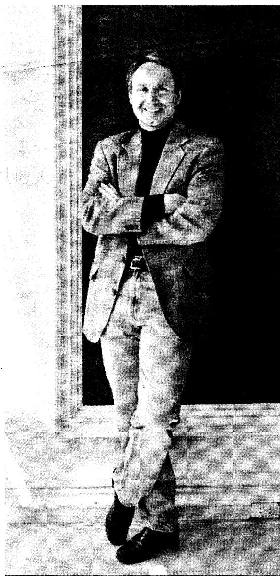
DAN BROWN. El autor de 'best-sellers' posa desenfadadamente.

La polémica suscitada ha tenido un efecto paradójico. Según fuentes de la que hasta ahora ha sido la editorial en España de Dan Brown,