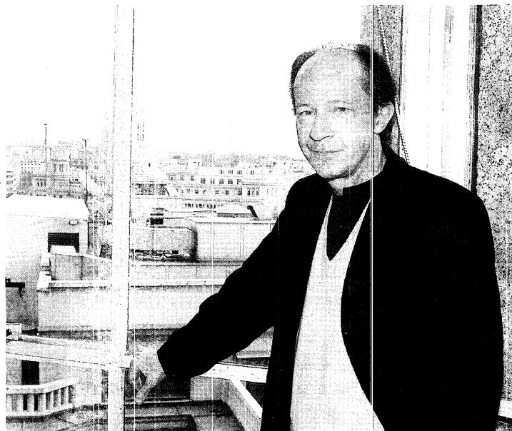
PENSADOR. Giorgio Agamben se ha convertido en una lectura imprescindible.

UNO no puede leer sólo a Baudrillard y a Jameson para entender la deriva terminal del mundo globalizado. A partir de un momento determinado se hizo también necesario leer a Slavoj Zizek, el gran provocador escénico de la inteligencia contemporánea. Pero nadie puede entender nada en los cambios políticos de las últimas décadas y su conexión con la totalidad de la historia y la cultura occidentales si no ha leído a Giorgio Agamben, el pensador italiano que ha opuesto una potencia intelectual insospechada al "pensamiento débil" de moda en decenios anteriores.