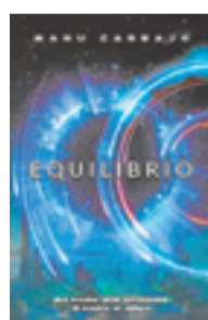
EQUILIBRIO MANU CARBAJO Editorial: Umbriel. 416 páginas. Precio: 19,50 euros

cómo nuestra sociedad genera enfermedades y un camino hacia la salud y la curación. En este revolucionario libro, el renombrado médico Gabor Maté analiza elocuentemente cómo las enfermedades crónicas y la mala salud en general van en aumento en los países occidentales que se enorgullecen de sus sistemas de atención médica. Casi el 70% de los estadounidenses toman al menos un medicamento recetado; más de la mitad toma dos. En Canadá, una de cada cinco personas tiene presión arterial alta. En Europa, la hipertensión se diagnostica en más del 30% de la población. Y en todas partes, la enfermedad mental adolescente está en aumento. Entonces, ¿qué es realmente «normal» cuando se trata de salud?