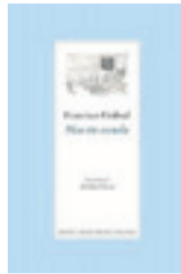
DIAS SIN ESCUELA FRANCISCO UMBRAL Instituto Leonés de la Cultura. León, 2023

'Días sin escuela', destinada a un premio oficial y provincial y no a publicarse en una editorial independiente, como la Alfaguara de Cela. En la crónica de la entrega del premio, publicada en el mismo número de 'Tierras de León' que la novela, aparece un Francisco Umbral repeinado y encorbatado recibiendo el galardón que le entrega la reina de las fiestas rodeada de sus damas, todas en traje regional.