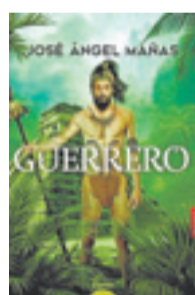
GUERRERO JOSÉ ÁNGEL MAÑAS Editorial: Algaida. 226 páginas. Precio: 19,90 euros

Estos breves 'Días sin escuela' pueden servir para que comencemos a reconciliarnos con quien, quizá a pesar de sí mismo, escribió algunas de las páginas más conmovedoramente perdurables de la literatura española.