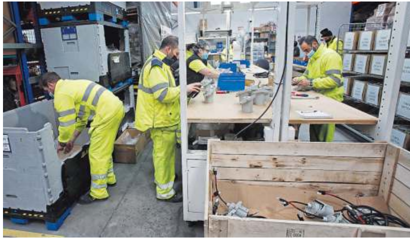
Setga tiene su nave en Pontevedra y prevé trasladarse al polígono de A Reigosa, en Ponte Caldelas, este año.