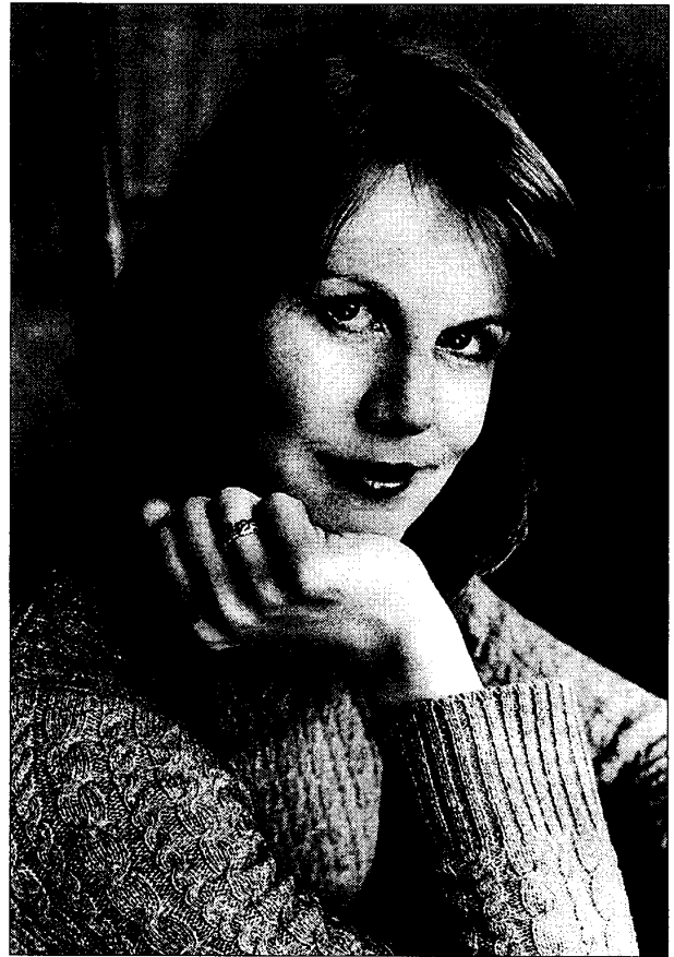
La novelista Elizabeth Kostova, autora de 'The Historian'.

« The historian llama la atención por muchas cosas», comenta Spinozzi. «Hay una gran historia de amor, hay relaciones entre padres e hijas, hay Historia, hay