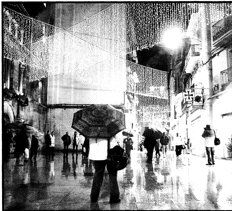
Ambient nadalenc a l'Eix Comercial de Lleida