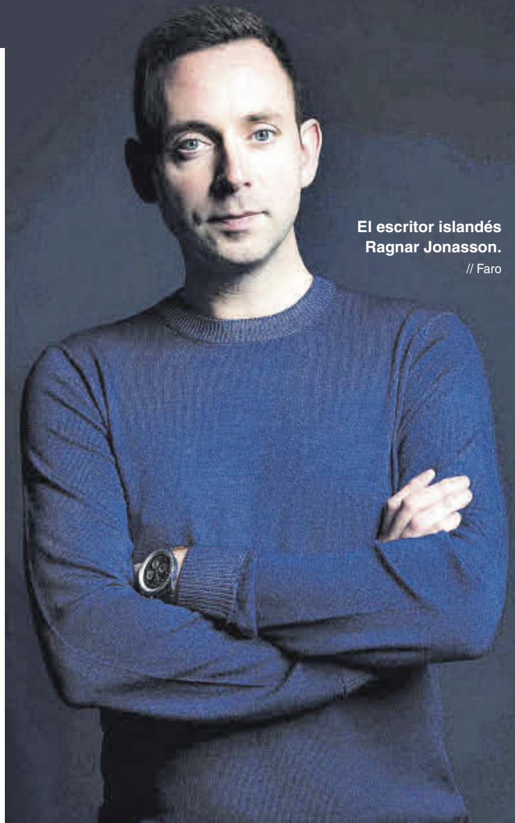
El escritor islandés Ragnar Jonasson.

Así que Ragnar Jónasson ha vuelto a demostrar que su estilo ya es un clásico. Sus comienzos con diecisiete años fueron traducir al islandés a Agatha Christie y con La sombra del miedo (Seix Barral), inició su viaje con la primera novela