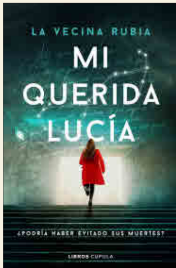
La vecina rubia Mi querida Lucía LIBROS CÚPULA

❖ Inglaterra, 1916. Lou Crane, una joven promesa de la danza, es arrancado de los escenarios para luchar en la Gran Guerra. Dos años después, regresa con una cojera permanente y la certeza de que no volverá a bailar. Además de sus sueños, la guerra le ha arrebatado a sus personas más queridas, y mientras la vida retoma su curso, Lou se queda atrás. Cuando le ofrecen impartir lecciones de teatro a los niños de un pequeño pueblo remoto, Lou encuentra en ello la oportunidad de huir de Londres.