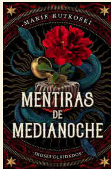
Marie Rutkoski Mentiras de medianoche PUCK

❖ Aquel sofocante verano de 2002, Lucía Romasanta, astróloga, madre soltera y redactora de la sección del horóscopo con más éxito del país, recibe una perturbadora carta. Un texto manuscrito que le hace directamente responsable de la muerte de una desconocida en caso de que no tome partido. A esta primera carta le seguirán otras, cada vez más amenazadoras... Una historia que pasará a formar parte de las investigaciones de la Policía Judicial como el famoso «Caso del horóscopo».