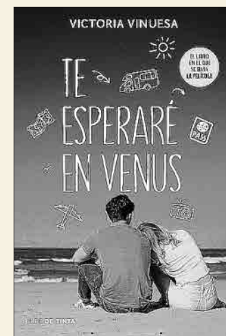
Victoria Vinuesa Te esperaré en Venus NUBE DE TINTA

❖ Tierno e intenso, Abejas y truenos lejanos es la historia inquebrantable de amor, valentía y rivalidad de tres jóvenes que empiezan a comprender el significado de la amistad. En una pequeña ciudad costera, a un tiro de piedra de Tokio, se celebra una prestigiosa competición de piano. A lo largo de dos febriles semanas, tres músicos vivirán algunos de los momentos más felices (y dolorosos) de sus vidas. Aún no lo saben, pero cada uno cambiará de un modo profundo e impredecible a los demás.