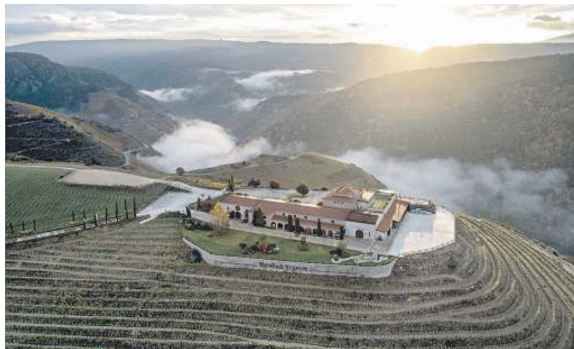
Vista de la bodega y el viñedo que la rodea, de unas veinte hectáreas, con un mirador hacia los cañones del río Sil.

El se incorporó a la compañía en el 2002, al año siguiente de la inauguración de Regina Viarum, la bodega que mira a los cañones del río Sil desde el municipio de Doade, en la principal subzona de la denominación de origen (DO) Ribeira Sacra, Amandi. Y ha sido elegida por los usuarios de la web especializada en regalos-experiencia Aladimia.com como una de las mejores de toda España para las catas. «Es una de las bodegas más visitadas de Galicia, andamos entre 25.000 y 26.000