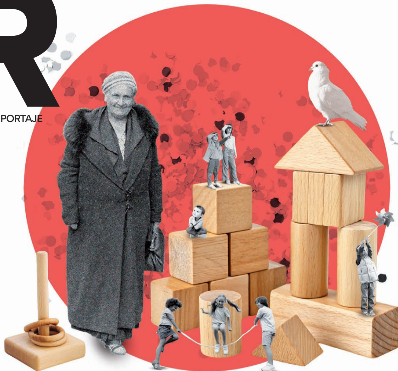
Ilustración: Laura Monsoriu

El pasado 23 de diciembre se cumplieron 110 años de la primera visita de la pedagoga italiana a Barcelona, ciudad que acabó convirtiendo en su casa hasta 1936. Su modelo educativo sigue estando vigente, sobre todo en Catalunya, al igual que sus obras, un referente para la formación de maestros y maestras.