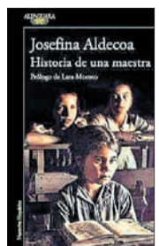
Historia de una maestra Josefina Aldecoa Alfaguara (2021) 240 páginas. 18,90 euros

Estas pocas líneas, escritas ya desde los Países Bajos, son particularmente elocuentes en cuanto subrayan de qué manera la propuesta pedagógica de Montessori está estrechamente ligada a una reflexión que trasciende lo estrictamente educativo: su catolicismo no dogmático y no siempre acorde con la doctrina –tuvo un hijo fuera del matrimonio que creció con sus abuelos paternos y ella siempre rechazó el matrimonio, considerándolo una prisión para la emancipación de la mujer–, su compromiso con la causa de las mujeres y su absoluta convicción de que la educación es la herramienta principal para alcanzar la igualdad están detrás de sus textos, especialmente de los más políticos.