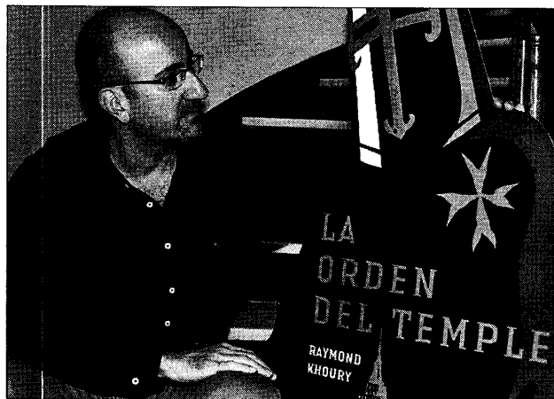
El escritor Raymond Khoury, ayer, en la presentación de su novela en Barcelona.

quim Sabaté adelantó que se llevará a cabo una campaña publicitaria en los cines y en los autobuses urbanos para dar a conocer al público esta novela que, a su juicio, «engancha desde el primer momento».