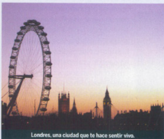
Londres, una ciudad que te hace sentir vivo.