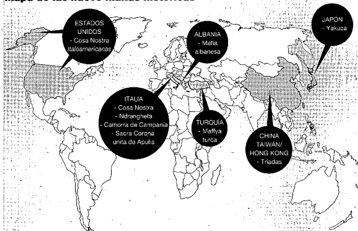
Mapa de las nueve mafias históricas

G. R. S. VALENCIA.- Drogas, prostitución, atracos agresivos, robos por Internet, extorsiones, dinero negro, juegos de azar, chantajes a altas personalidades, asesinatos mediante sicarios, mendicidad falsa, blanqueo de capitales con empresas tapadera, venta de niños, utilización de menores para perpetrar actos delictivos, trata de blancas, intercambio de coches de impor-