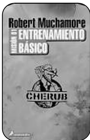
MISIÓN 01: ENTRENAMIENTO BÁSICO. Robert Muchamore. Salamandra

Tras la Segunda Guerra Mundial e inspirándose en el éxito obtenido por los chicos que colaboraban con la Resistencia francesa, un espía inglés llamado Charles Henderson entrenó a veinte niños ingleses con el objeto de que participaran en operaciones secretas. El nombre en clave de esta unidad era Cherub (querubín), y desde entonces ha prosperado hasta convertirse en una poderosa organización.