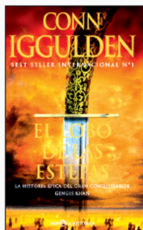
Conn Iggulden EL LOBO DE LAS ESTEPAS La Esfera de los Libros-2008

Quién no se ha visto deslumbrado en alguna ocasión con la figura de Alejandro Magno, Ricardo Corazón de León o Gengis Khan, todos mitos de la historia y de la literatura universal. El lobo de las estepas es la historia épica de este último, desde que su familia fuera expulsada de la tribu de Los Lobos cuando tenía tan solo once años. La literatura pero también el cine y el cómic se han encargado de magnificar o dulcificar su figura, según interesara. Por eso es esta la historia de una época que conviene no olvidar para entender la nuestra propia.