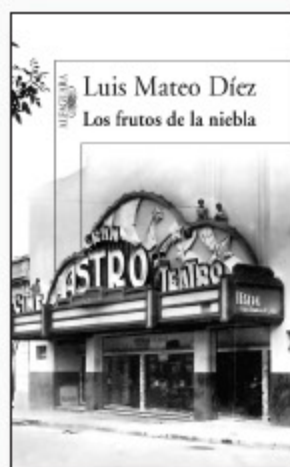
Luis Mateo Díez LOS FRUTOS DE LA NIEBLA Alfaguara-2008