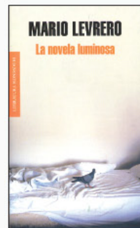
Mario Levrero LA NOVELA LUMINOSA Mondadori-2008

Novela negra italiana, Gianrico Carofiglio ya ha firmado otras dos obras con gran éxito. Dudas razonables es una novela negra con el boxeo como excusa, en la que su protagonista deberá enfrentarse a la propia Mafia para demostrar la inocencia de su defendido. En tiempos en los que la Camorra parece cobrar actualidad, este tipo de novelas son muy recomendables.