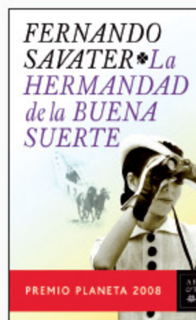
Fernando Savater LA HERMANDAD DE LA BUENA SUERTE Premio Planeta-2008

Dice Luis Mateo Díez que con Los frutos de la niebla se clausura la serie narrativa 'Las fabulas del sentimiento', compuesta por doce novelas cortas y distribuidas en cuatro volúmenes. Volvemos a encontrarnos aquí con su peculiar mundo narrativo, uno de los más espesos de la literatura española. Volvemos a encontrarnos con el desasosiego que impregna su obra, con el misterio de sus novelas. Es Luis Mateo Díez.