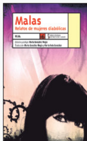
Varios autores MALAS. RELATOS DE MUJERES DIABÓLICAS Lengua de Trapo-2008

Pues ya tenemos aquí al Premio Planeta 2008, un Planeta peculiar que inspira confianza (literaria) habida cuenta de quien lo firma. Savater, finalista en 1993 del mismo Premio, es el autor de La hermandad de la buena suerte , una novela de aventuras en la que se entremezclan criminales, aventureros, jockeys, caballos de carreras y una interpretación metafísica del bien y del mal. En definitiva, Savater en estado puro.