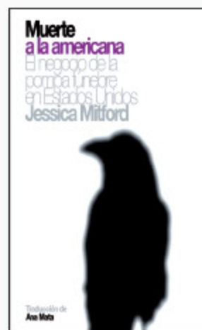
Jessica Mitford MUERTE A LA AMERICANA Global Rhythm Press-2008

Quién no se ha visto deslumbrado en alguna ocasión con la figura de Alejandro Magno, Ricardo Corazón de León o Gengis Khan, todos mitos de la historia y de la literatura universal. El lobo de las estepas es la historia épica de este último, desde que su familia fuera expulsada de la tribu de Los Lobos cuando tenía tan solo once años. La literatura pero también el cine y el cómic se han encargado de magnificar o dulcificar su figura, según interesara. Por eso es esta la historia de una época que conviene no olvidar para entender la nuestra propia.