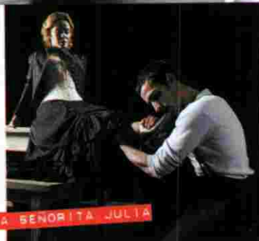
LA SEÑORITA JULIA