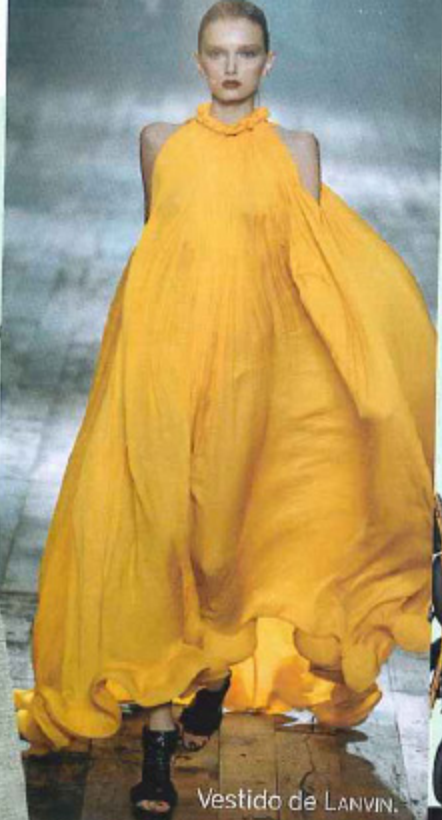
Vestido de LANVIN.