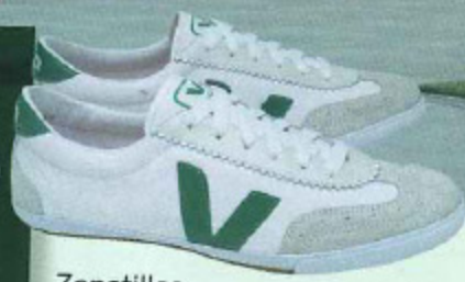
Zapatillas ecológicas VEJA y bici de CHANEL.