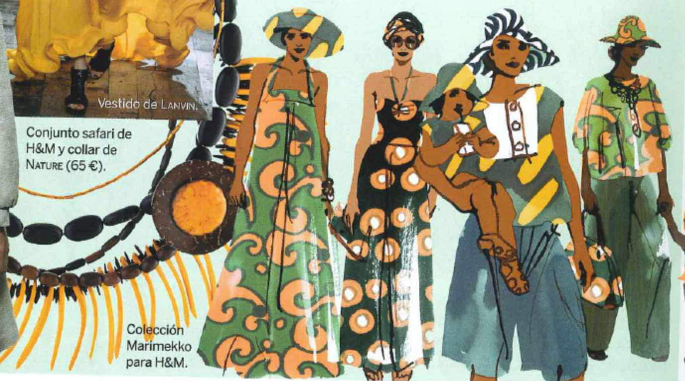
Colección Marimekko para H&M.