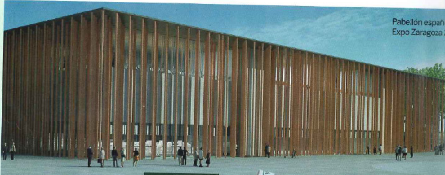
Pabellón español Expo Zaragoza 2008

Harás ejercicio y podrás invertir la cuota del gimnasio en una top bicicleta como la de Chanel. ¿Más? El libro 'Planeta frito' (Ed. Urano) te dice cómo ahorrar energía.