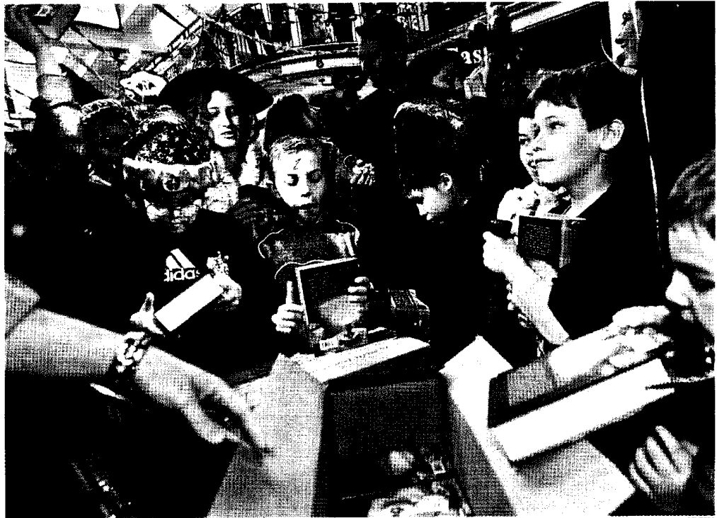
La publicación de un libro de Harry Potter siempre provoca gran expectación. El último saldrá a la venta en julio