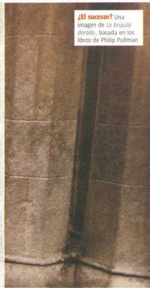
¿El sucesor? Una imagen de La bruja dorada , basada en los libros de Philip Pullman