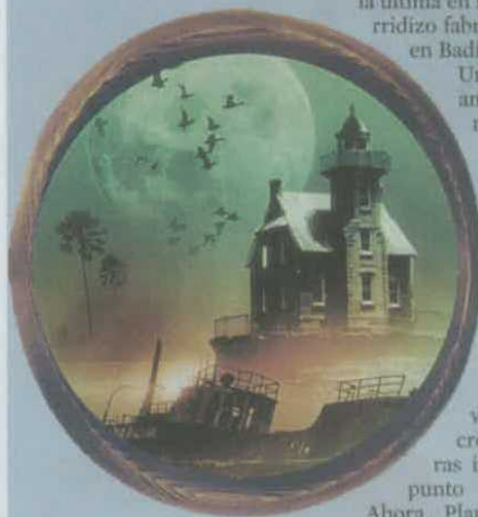
Detalle de la ilustración de portada de 'La trilogía de la boira' de Carlos Ruiz Zafón

Ahora, Planeta recupera las tres novelas y las publica por primera vez en su edición definitiva en un único volumen titulado La trilogía de la niebla en castellano y La trilogía de la boira en catalán. Un libro voluminoso y muy cuidado con una sugerente portada, azul en castellano y amarillo-verde en catalán, para acercar a los jóvenes lectores unas obras que ya se han convertido en clásicas. Clásicas de nuestro tiempo.