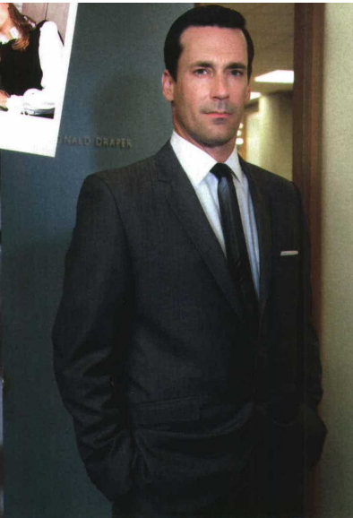
A la izda., Robert De Niro en los 70 con 20 kilos menos. A la dcha., Jon Hamm, protagonista de «Mad Men».