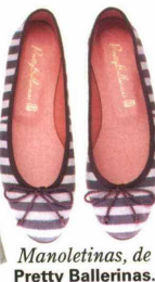
Manoletinas, de Pretty Ballerinas .