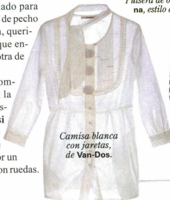
Camisa blanca con jaretas, de Van-Dos .