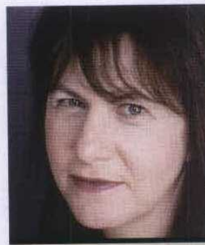
LINDA GRANT (Liverpool, 1951) es periodista y crítica literaria. La Ropa que Vestimos es su primera obra de ficción y ha quedado finalista del premio Man Booker 2008.

precisamente, cuando muestra su capacidad para interpretar un texto compuesto de algodón y seda. Su observación es tan rigurosa y absoluta que no hay espacio para la duda o el despiste. La autora consigue alcanzar cotas de intensidad inusuales con