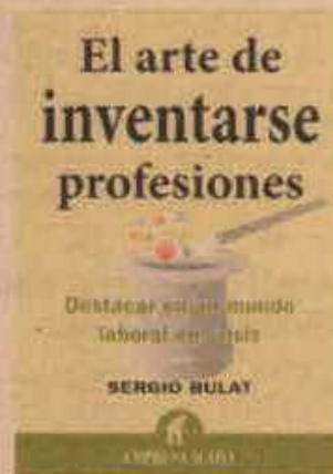
'Inventar profesiones' Autor: Sergio Bulat Editorial: Emp. Activa

su entorno para redirigir su carrera. Destaca el caso de una ingeniera que encontró su lugar como especialista en factores humanos, o un ejecutivo de una firma de software que además es el comisionado de golf de la oficina.