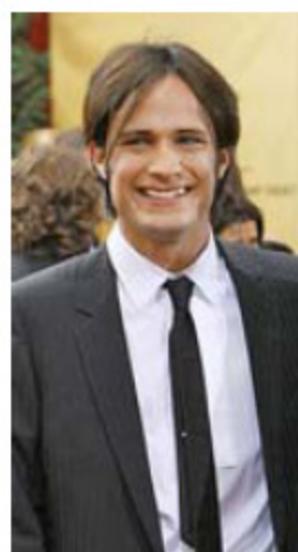
Gael García Bernal.