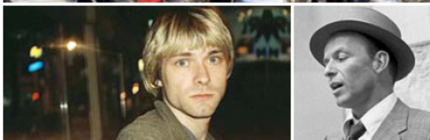
Arriba, Lenoir biografía a The Ramones. Abajo, Caelus analiza a Kurt Cobain y Global, a Sinatra.