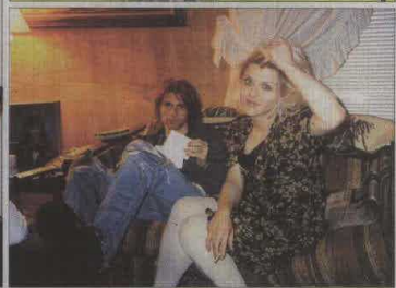
PATRIMONIO DE KURT COBAIN