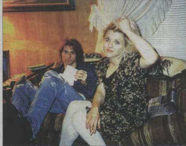
PATRIMONIO DE KURT COBAIN