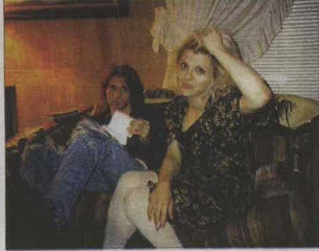
PATRIMONIO DE KURT COBAIN