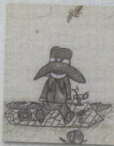
Dibujo de Kurt.

Una de las grandes aficiones de Kurt Cobain era dibujar. Y, como la mayoría de los niños, hizo esta carta para sus padres. Tenía 13 años. La diferencia es que en el dorso Kurt escribió en forma de copyright: “Una tarjeta de felicitación de Kurt Cobain”.