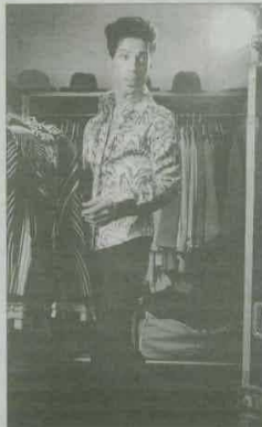
►► Prince, en el libro.

VERSIÓN DE LED ZEPPELIN / El volumen incluye un compacto en directo, Indigo nights. Live session , grabado en IndigoO2, sala integrada en el complejo del O2 Arena en la que Prince ofreció diversas actuaciones informales. Contiene 15 interpretaciones abrumadoras entre las que se cuelan clásicos ( Girls and boys , Delirious , Alphabet street ) y versiones de