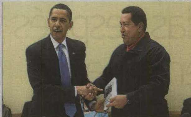
Hugo Chávez entrega a Obama Las venas abiertas de América Latina .

Según Obama, la solución de Afganistán pasa por Pakistán, y los estrategas del Pentágono ya han acuñado la expresión AfPak para referirse a ella. Ahmed Rashid acaba de publicar su último ensayo, Descenso al caos (Península), subtítulo muy gráficamente Estados Unidos y el fracaso de la construcción nacional en Pakistán, Afganistán y Asia