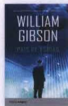
País de espías William Gibson Plata 384 págs. 18 €

Honestamente, nunca lo he visto como el malo de la película, aunque tampoco considero que sea el personaje más realista de estas dos novelas. Es un personaje muy útil para el autor, capaz de hacer cosas raras, sin apenas un motivo, pero sin destruir la trama... ¿Por qué ha hecho eso? Porque es Bigend. Puede hacer cosas desagradables. Pero su análisis de cómo funciona el mundo es muy parecido al mío. Creo que Bigend es una fuerza de la naturaleza de todo lo inteligente que existe en el capitalismo moderno... aunque el capitalismo moderno sea una gran decepción. ■