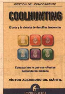
Coolhunting Autor: Víctor Alejandro Gil Mártil Editorial: Empresa Activa Precio: 12 euros

Uno de los atractivos de la obra de este especialista universitario en Sociología del consumo es que resulta eminentemente práctica y, además de descubrir la base teórica, las herramientas y las claves