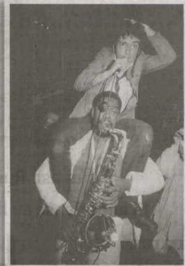
DE GIRA. En una hamburguesería de un amigo, arriba. Springsteen de concierto: en Minnesota y en el Madison Square Garden con Clarence Clemons.

angustia la idea de repetir la borrachera de éxito de 'Born to Run'. Y su posterior resaca. Además, en este disco quería contar una historia, mantener un hilo narrativo de la primera a la última canción, por eso descartó aquellas que no casaban con el argumento de un cuento titulado 'Oscuridad en los límites de la ciudad'.