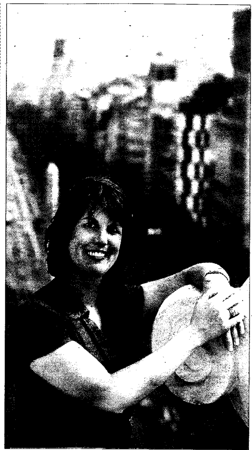
Elizabeth Kostova fa uns dies a Barcelona