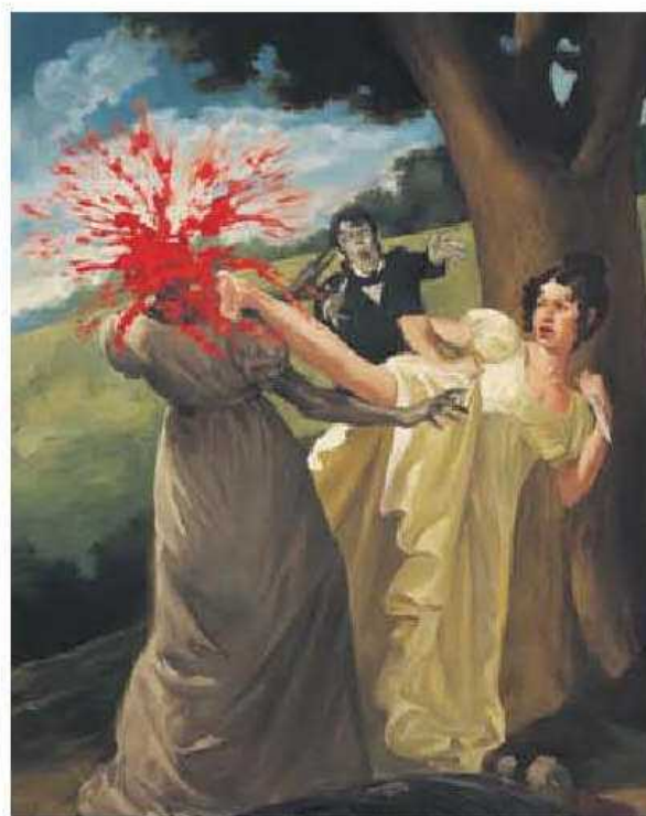
IMAGEN DE 'ORGULLO, PREJUICIO Y ZOMBIS'

que en esta ocasión, además de luchar contra las normas impuestas por la sociedad, los protagonistas se enfrentan día sí y día también con un 'virus' que ha infectado las tierras inglesas: una plaga de zombis que parece no tener fin. Las hermanas Bennett, expertas en artes marciales, se pasan la obra luchando contra muertos vivientes, ayudadas por sus nuevas amistades e incluso algunos de sus amigos más cercanos terminan sucumbiendo a este mal. Puede que a los más clasicistas le parezca esta obra una aberración, pero el autor respeta la trama a conciencia, tan sólo soltando ataques de muertos vivientes cuando considera oportuno (que es en muchas ocasiones). Es una novela divertida, sangrienta, eso sí, y tan poco convencional que ahí reside su magia. De vez en cuando hay que poner un toque cómico a las grandes novelas y quizá la presencia de zombis y artes orientales sea un aliciente para todos aquellos que aún no se han atrevido a leer a Austen.