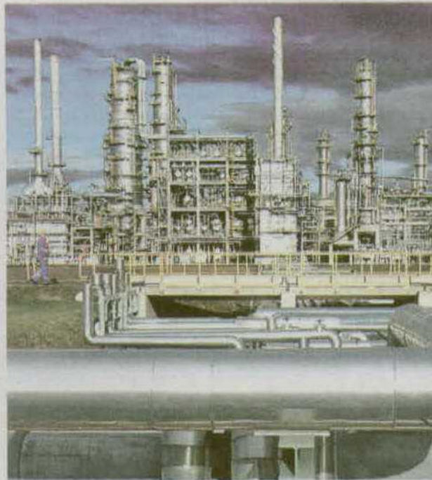
Instalaciones de una refinería de TOTAL en Alemania.

"La demanda de petróleo ha caído este año por primera vez desde los 80, así ha sido de grave la recesión", afirma Rubin, quien vaticina que "los precios subirán a medida que lo haga la demanda, y será entonces cuando el precio del petróleo alcance los tres dígitos". La consecuencia será que "en los próximos 10 años, 50 millones de coches