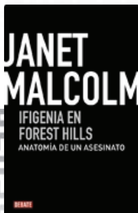
Debate. 208 Págs.