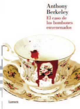
Lumen. 256 págs.

En el Londres de los años veinte, seis miembros del Círculo del Crimen se reúnen para tratar de resolver un asesinato que ha desconcertado a Scotland Yard: la muerte de la señora Joan Bendix por envenenamiento. A lo largo de seis noches con-