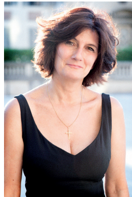
La escritora Sophie Fontanel.

Olvidamos en la base de la acción toda posibilidad de sueño, nos convertimos en meros autómatas, también del sentimiento, también del sexo. Sophie decide escuchar al cuerpo: "Ya no soportaba el dejarme hacer. Había dicho si demasiadas veces. No había te-