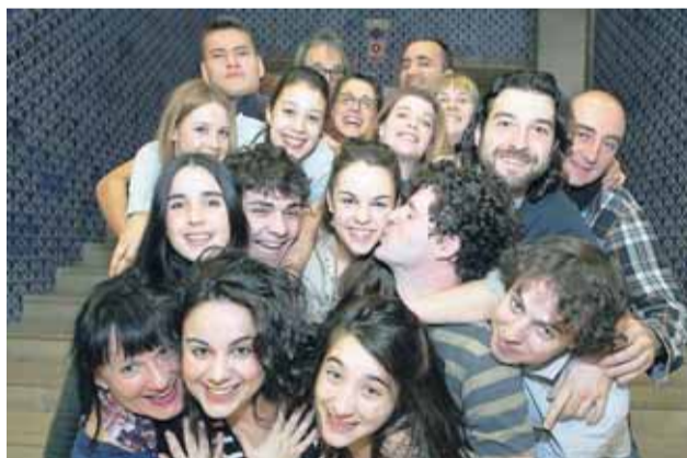
Los alumnos de Interpretación y sus profesores.

treno en Gijón harán la acostumbrada gira por Asturias, saldrán por primera vez de las fronteras españolas. 'Cruzadas' se verá en una localidad cercana a Bruselas, mientras que 'The Rocky Horror Show' podría ir a Oporto, localidad portuguesa con la que la escuela tiene un intercambio Erasmus.