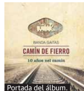
Portada del álbum.

El nombre le viene a la formación de la antigua vía de ferrocarril que cruzaba los concejos de Santu Adrianu, Proaza, Quirós y Teberga. Ahora, desaparecidas las vías, se la llama turísticamente