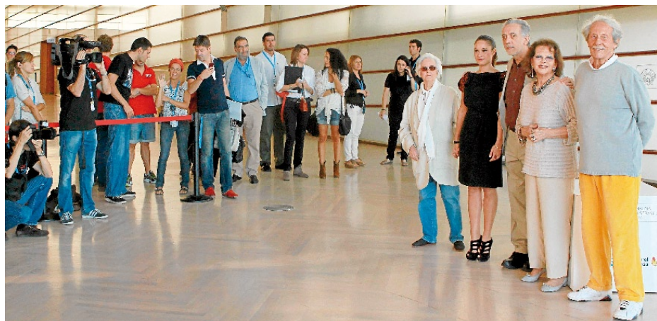
O equipo de actores e actrices da película de Trueba, onte en San Sebastián.

PAZO DE MARIÑÁN Dentro de las actividades paralelas del X Premio Luis Ksado de fotografía destacan los talleres de Manuel Outumuro (uno de los más importantes fotógrafos de moda) y Joan Fontcuberta (ganador de los premios nacionales de fotografía y ensayo) que tendrán el 1 y 3 de octubre en el pazo de Mariñán. REDACCIÓN