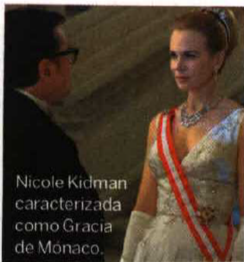
Nicole Kidman caracterizada como Gracia de Mónaco.

En marzo de 2014 llegará "Grace of Monaco", donde Kidman da vida a la estrella de cine primero y princesa de Mónaco, después. El film retrata la crisis de Grace Kelly durante un conflicto entre Rainiero (Tim Roth) y Charles De Gaulle y no ha gustado a los Grimaldi por ser «innecesariamente "glamourizado" y políticamente incorrecto».