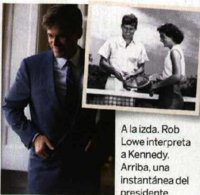
A la izda. Rob Lowe interpreta a Kennedy. Arriba, una instantánea del presidente.

National Geographic Channel ha estrenado en todo el mundo el documental de ficción "Killing Kennedy", coincidiendo con el 50 aniversario del asesinato del presidente. Protagonizado por Rob Lowe, producido por Ridley Scott y basado en el libro de Bill O'Reilly, el film reproduce fielmente el magnicidio.