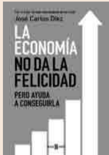
Plaza & Janés.